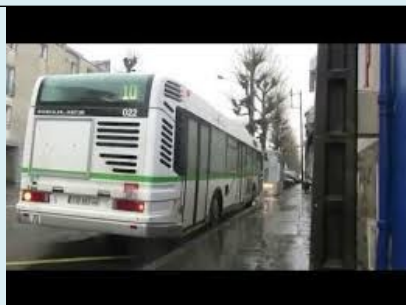
Ceci n'est pas un chronobus (ligne 10)