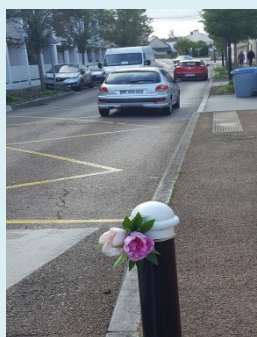
Ceci est hélas un hommage (éphémère et vite enlevé) à une piétonne fauchée à Saint Sébastien