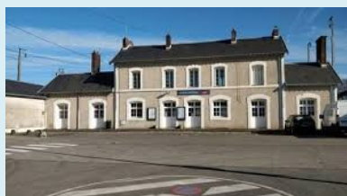
Ceci n'est pas un pôle multimodal (gare de Chantenay)