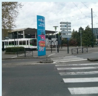
Station Recteur Schmidt

En réclamant comme prioritaire la liaison des lignes 1 et 2 du réseau tramway