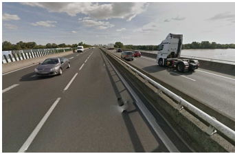
pont de Bellevue

Des infrastructures conçues sans voie pour le transport public