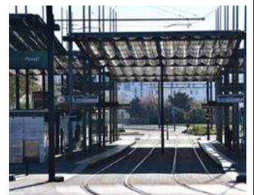
Station « Pirmil » en avril durant le confinement

Nous essayons actuellement de développer les propositions à présenter dans le cadre des relations entre le Collectif transport et la direction des transports et de la mobilité de Nantes Métropole. D'autant plus qu'interfère désormais la mise en place des instances de concertation prévues par la Loi d'Orientation des Mobilités et la mise en avant par la SNCF des Services express métropolitains dans trois agglos de la région (Nantes, Le Mans, Angers). Pour suivre tout cela ayez le réflexe de consulter notre site internet que nous nous efforcerons d'actualiser.