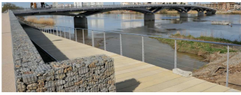
pont Sedar Senghor