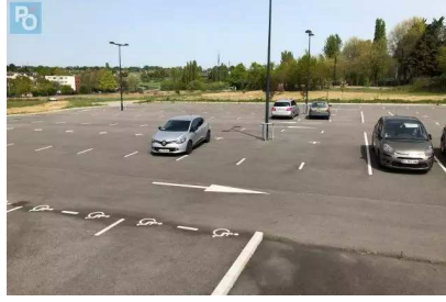
Parking « Babinière » : un « no man's land » qui ne devrait pas le rester